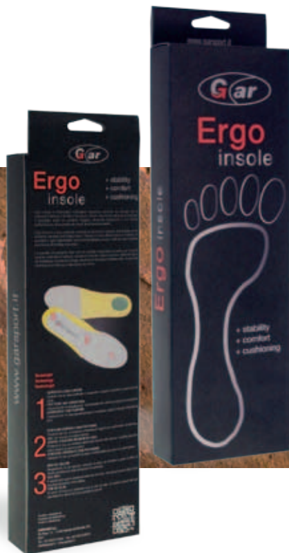
GARSPORT ERGO INSOLE